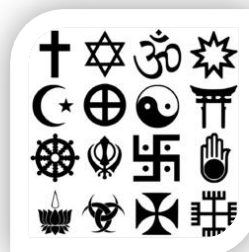
Símbolo del pluralismo religioso